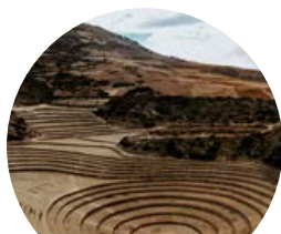
Maras e Moray