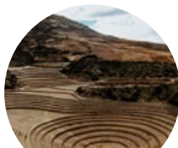
Maras e Moray