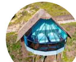
Mountain Sky View