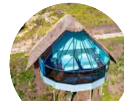
Mountain Sky View