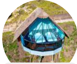
Mountain Sky View