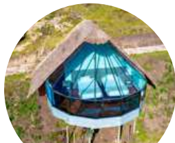
Mountain Sky View