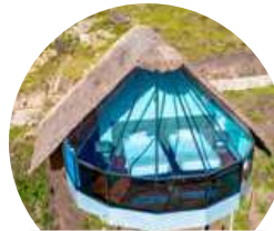
Mountain Sky View

Como nuestros antepasados, somos muy considerados con la Pachamama (Madre Tierra). Por ello, nuestros campamentos y lodges están adaptados al entorno para no generar impactos negativos.