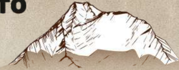
AUSANGATE 6372 m. / 20905 Ft.